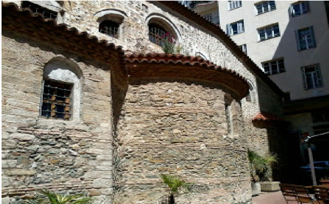
Αυτό είναι το πίσω μέρος του ναού.