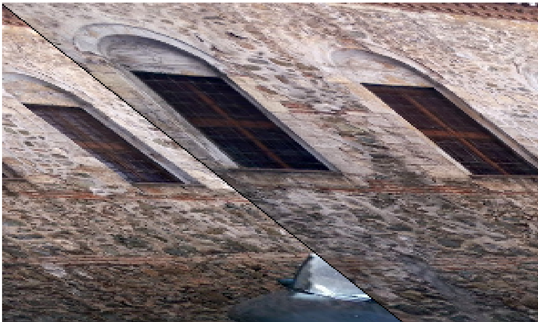
Σε αυτή τη φωτογραφία μπορείτε να δείτε το πλάι του ναού και το σχεδιασμό των παραθύρων της.