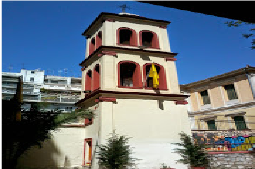
Αυτό είναι το καμπαναριό του ναού.